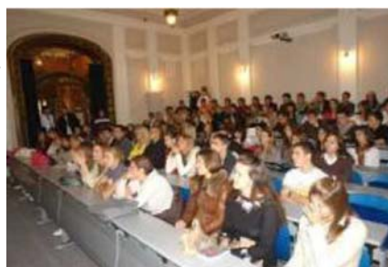
Бруцоши на Банкарској академији

Такође, представници факултета и Универзитета редовно учествују на сајмовима образовања и презентацијама који се организују у месецима пре уписа, где будући студенти и студенткиње могу добити све информације у вези са уписом и студирањем на факултетима.