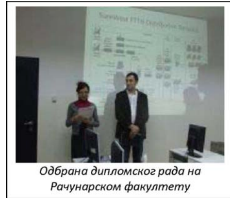
Одбрана дипломског рада на Рачунарском факултету

На Факултету за дизајн реализују се 3 студијска програма, након којих се стиче звање: