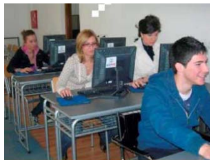
Компјутерска учионица на Правном факултету

Високошколске установе у саставу Универзитета Унион у реализацији својих студијских програма користе савремена средства наставе и комуникације , и свака од њих има опремљене рачунарске лабораторије са адекватним бројем рачунара и рачунарске опреме и интернет везом, као и персоналне рачунаре које користе наставници. Сви рачунари опремљени су основним корисничким програмима , као и специфичним програмима и базама података који се користе у наставном процесу. Универзитет поседује адекватну опремљеноср рачунарима и рачунарском опремом, као и другом опремом која је потребна за вршење функција и задатака Универзитета.