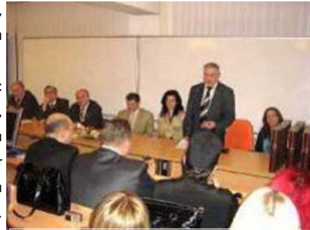
Промоција специјалиста, магистара и доктора наука на Факултету за индустријски менаџмент у Крушевцу

Осим у настави, наставници и сарадници укључени су и у: научноистраживачке пројекте Министарства науке и других министарстава, научноистраживачке и развојне пројекте које финансирају домаће и иностране компаније и организације, као и у пројекте који су резултат међународне сарадње међу државама, високошколским установама и међународним организацијама и специјализованим агенцијама. Наставници и сарадници Факултета често су ангажовани као консултанти или као чланови експертских група у области за коју су изабрани, али и као предавачи на многим универзитетима у иностранству и чланови међународних експертских тимова.